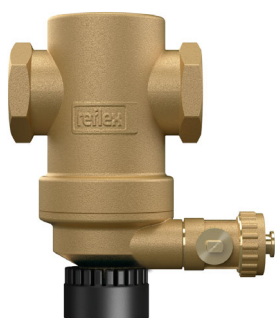
AT8042ME20, 3/4" med magnetindsats

Der findes ingen dele som kan udskiftes på denne type snavssamler.