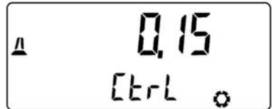
...och en negativ temperaturdifferens \geq 0,15 \text{ K} .