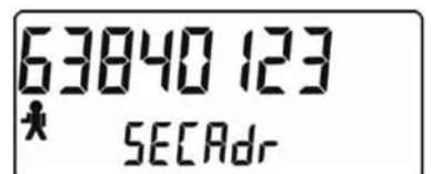
Exempel: M-Bus sekundäradress