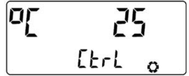
Brytpunkt för kylmätning när tilloppstemperaturen är 25 \text{ gr. C} ...