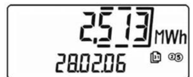
Exempel: månadsvärde värme energi