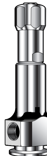
AT4981, med gastätt lätt- verk